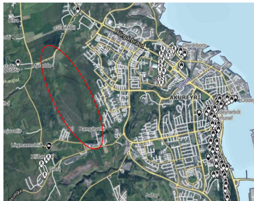
Mynd 2.2 Friðlýstar og friðaðar fornminjar á Akureyri. Svæðið sem skipulagsbreytingin tekur til er innan rauða hringsins. Skjáskot af Map.is/minjastofnun .

Samkvæmt Minjavefsjá eru engar skráðar fornleifar á fyrirhugaðri strengleið innan Akureyrarbæjar. Fyrir liggja þrjár fornleifaskráningar fyrir svæðið en aðeins ein þeirra uppfyllir núgildandi staðla Minjastofnunar um fornleifaskráningu vegna skipulags og þarf því að endurskoða fornleifaskráningu á áætluðu áhrifasvæði áður en framkvæmdaleyfi er veitt.